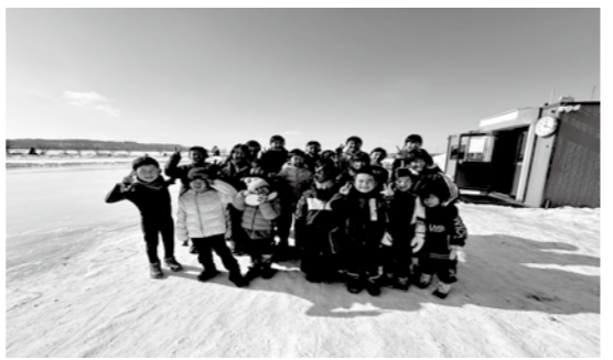
参加した豊頃 & 浦幌少年団のみんなて記念撮影