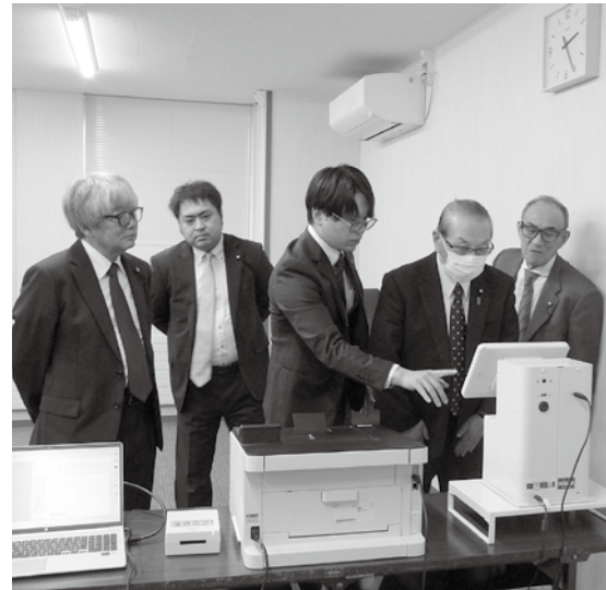
書かない窓口システムを操作体験

委員からは、書かない窓口システムと事務処理システムを連携することで、更に負担を軽減できるのではないかといった意見が出ました。