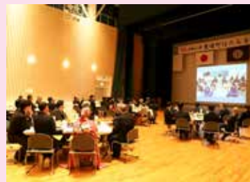
▲交流会で中学校時代の思い出をスライドショーで振り返る様子（右） 豊頃ねんどクラブの記念品（お茶碗）を披露（左）