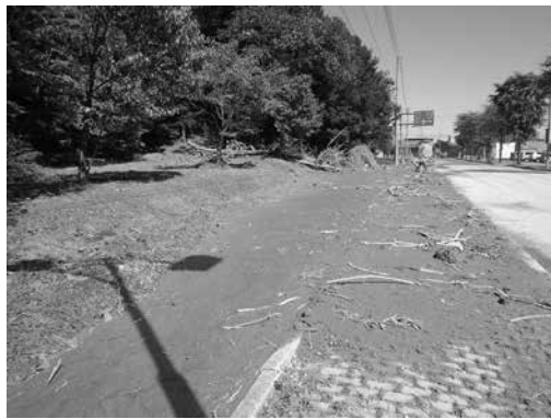
こどもプラザ付近では、林地の地すべりが発生