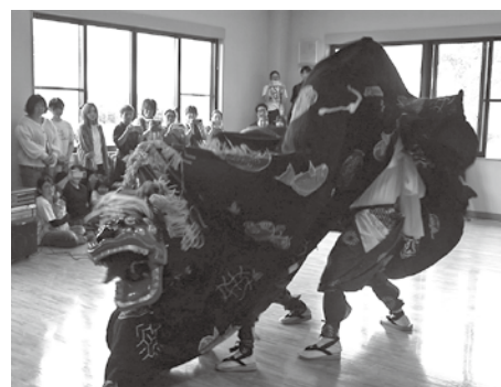
令和7年9月に奉納された二宮獅子舞神楽

更新頻度が低く、施設の魅力が伝わりにくいのが現状です。利用案内や展示内容のPRのほか、ホームページの見やすさの向上などを検討しています。