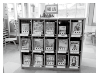
▲最新号以外は「2週間」借りられます

「雑誌」6誌を入替えました 「生活」に「変化と潤い」を 図書館には「雑誌」専用の書棚があることをご存じでしょうか。 健康、料理、子育て、旅行、ファッション、文芸など、幅広い年齢層に向けた雑誌29誌が置かれています。 4月からは6誌を入替えましたので、ぜひ、お越しください。 「生活」に、変化と潤いの一誌に巡り合うかもしれません。